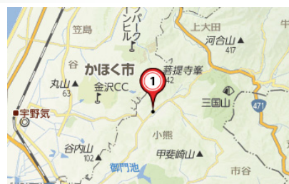
河北支所およびその位置図

津幡町種地区に津幡事業所とかほく事業所を統合し、河北支所として移転する準備を進めています。組合員の皆様にはご迷惑をおかけすることもあるかと思いますが、より迅速にご要望にお応えできるよう従業員一同努めて参りますので、ご協力よろしくお願いいたします。