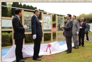
森林セラピー基地グランドオープン

http://www.town.tsubata.ishikawa.jp/therapy/