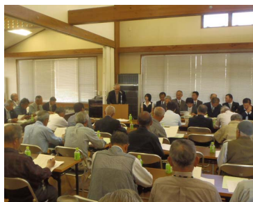
選挙管理者による結果報告