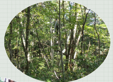
ジャングルのような雑木林