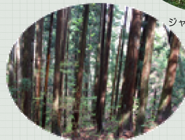
間伐されていないスギ林