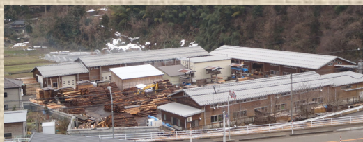
金沢ウッドプラザ（宮野工場）