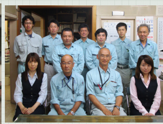
津幡・かほく事業所