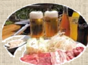
バーベキューセット