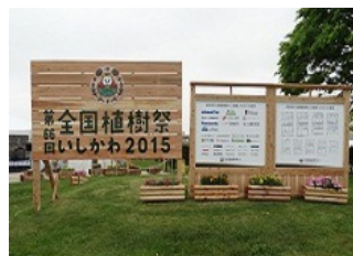
間伐材プランター