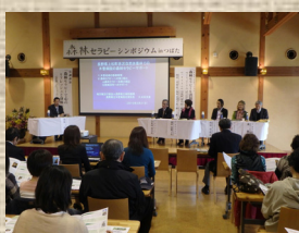
森林セラピーシンポジウム