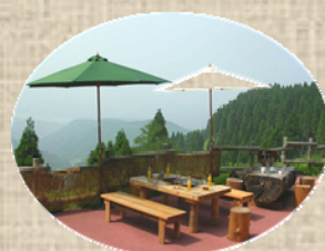
森のテラスからの眺望